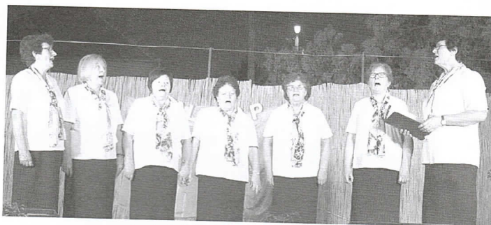
A népdalkör is fellépett a Falunapon