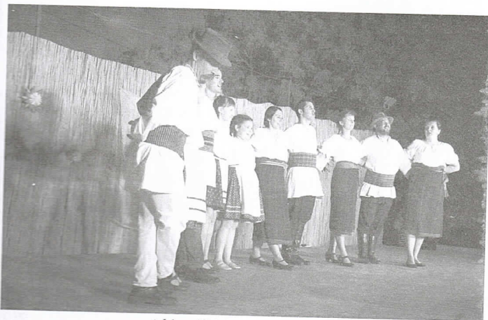
A kisszállási néptánc csoport