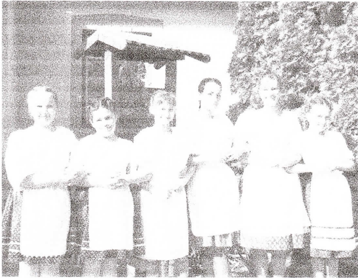
A néptáncosok is részt vettek a jeles eseményen

Vigassággal telt a hétvége Kisszálláson. A település szüreti felvonulással és bállal ünnepelt.