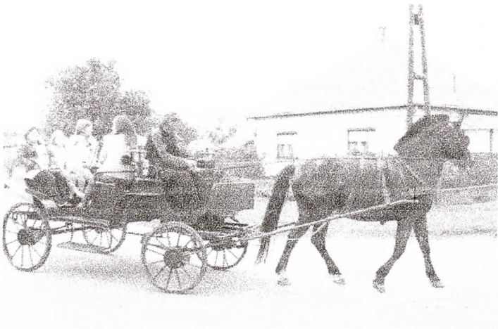
A menet végén haladt Bundula Melinda helyi útítársaival